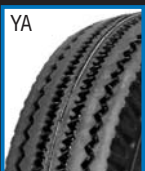
***Profil YA Schnellläufer bis 70 km/h / 400 kg